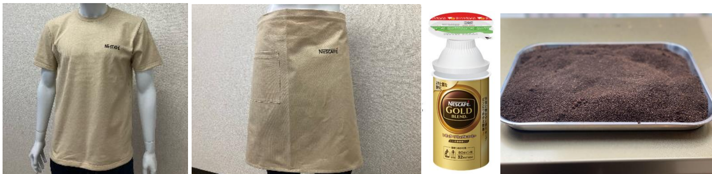
「ネスカフェ 原宿」等で活用する衣服(Tシャツ、エプロン)

アップサイクルの取り組みとして、「ネスカフェ エコ&システムパック」とコーヒー残渣で製作したTシャツとエプロンを、ネスレ日本直営カフェ「ネスカフェ 原宿」のユニフォームとして活用を開始します。なお、古紙から生み出した紙糸を使用した繊維を、コーヒーを染料として染色する試みは業界初(※2)となります。(※2)2022年2月時点、ネスレ日本・日清紡調べ