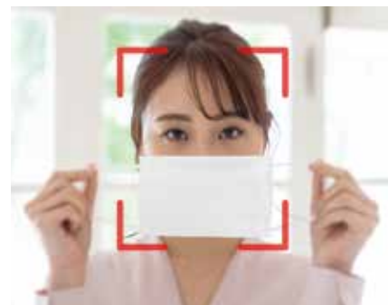
マスクの着用非着用を判断