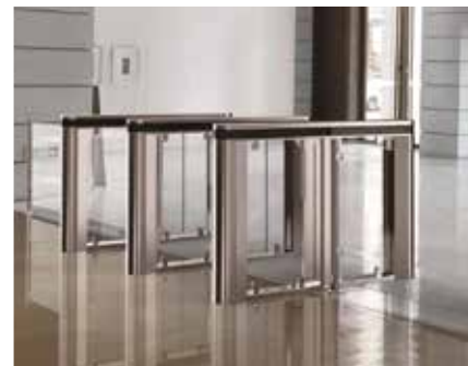
ゲートやドアとの連動も可能