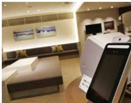
スタイリッシュに簡単設置