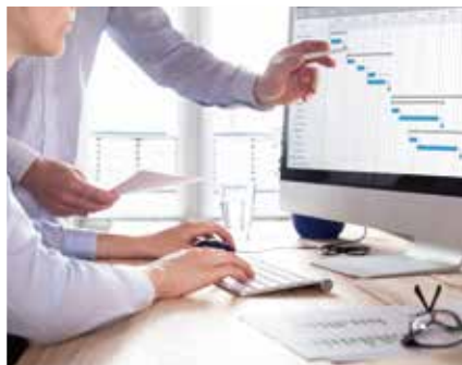
勤怠管理等のシステムとの連動も可