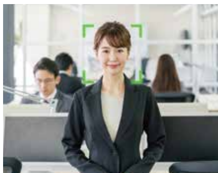
約1秒の高速認識で効率化